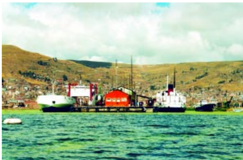
Færgehavnen i Puno med en rigtig jernbanefærgе til venstre. Båden i midten er fra 1900-tallet, mens den lille båd til højre er SIS Yavari fra 1860.

For nogle år siden havde klubben en mødeaften i Valby Medborgerhus, hvor temaet var „Jernbaner i Sydamerika“. Det var en interessant aften i særdeleshed for undertegnede, der efter at have set en artikel derom for 20 år siden i „La vie du Rail“ ønskede sig en rejse til Peru. Den rejse effektuerede jeg i efteråret 2001.