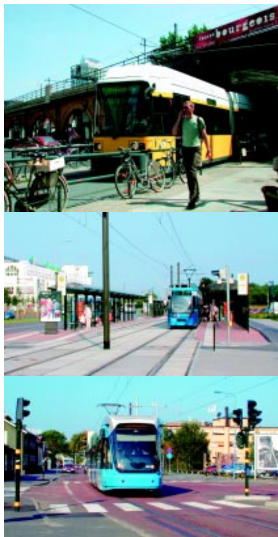
Eksempler på letbaner i vore nabolande; øverst Berlin BVG 5. juni 2003, i midten Rostock Lütten Klein 22. august 2001 og nederst Tvärbanan i Stockholm - Liljeholmen 18. september 2001. Sidst nævnte er en helt nybygget bane, der forbinder tre tunnelbaner i den sydvestlige del af byen.