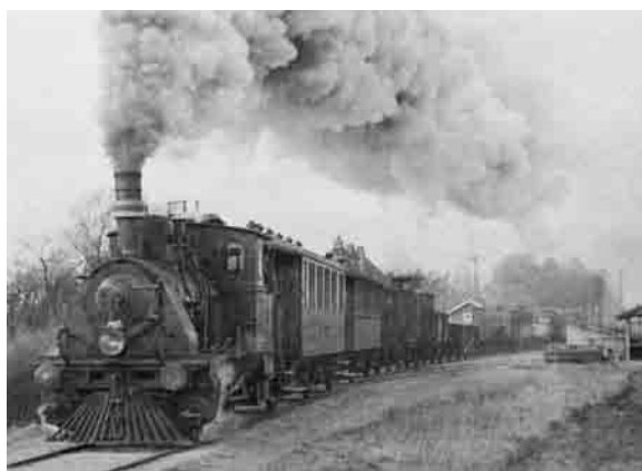
Stenvad ca. 1940

Fra Gjerrild Nordstrand blev der under Besættelsen sendt enorme mængder ral og grus til støbning af tyske forsvarsværker i Vestjylland. og flyvepladser ved Karup og Tirstrup. Efter Besættelsen voksede konkurrencen fra landevejstrafikken, og banens økonomi gjorde det umuligt at fortsætte. Gjerrildbanens sidste tog kørte i juni 1956. Bogen er en grundig beskrivelse af banens historie, hvor samspillet mellem bane og egn dokumenteres. I særskilt afsnit beskrives lokomotiver, motorvogne og vognmateriel med fotos og tegninger.